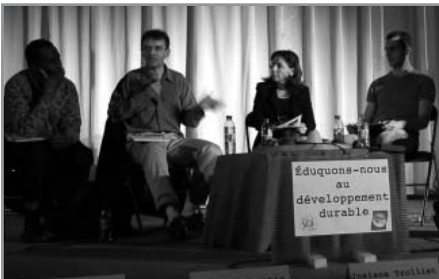
“Éduquons-nous au développement durable”, la première conférence-débat, le 8 novembre

– Outre l'exposition Les Graines du changement et les conférences, les pratiquants avaient transformé leur centre pour offrir : – une exposition de photographies et de textes de Daisaku Ikeda Dialogue avec la nature et Paroles de sagesse , – un coin vidéo présentant le film Une révolution tranquille (voir page 48), – des ateliers pour les enfants et – un stand de la Charte de la Terre.