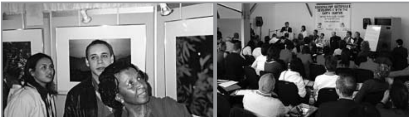
Mme MBeki, épouse du Président Sud Africain visite l'exposition. Le séminaire "L'éducation pour un mode de vie durable avec la Charte de la Terre".

ter de maintenant. La tente de la SGI est devenue en quelque sorte "la tente de la révolution humaine", que les gens quittaient en se sentant inspirés et forts. L'impact de l'exposition est devenu évident quand les organisateurs du Sommet nous ont remis le troisième prix de la meilleure exposition indépendante.