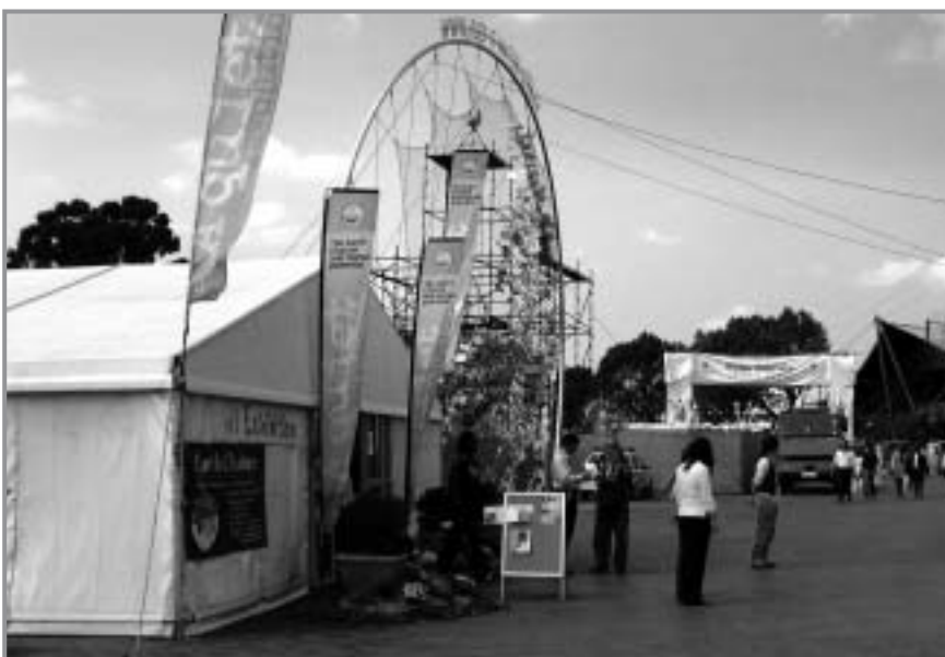
Johannesburg, l'exposition de la SGI au Sommet mondial pour un développement durable

le Sommet était organisé uniquement pour les experts et les gouvernements.