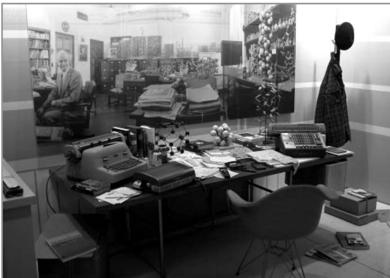
Reconstitution du bureau de Linus Pauling