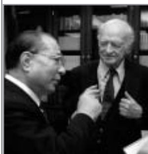
Rencontre entre Linus Pauling et Daisaku Ikeda en 1990 à Los Angeles