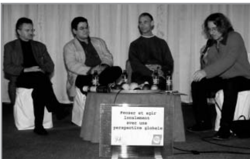
La deuxième conférence, “Penser et agir localement avec une perspective globale”

Ce projet avait pour but de mettre en commun différentes réponses aux problèmes de l'environnement, des réponses simples, issues de prises de conscience individuelles, qui devraient inciter chacun à devenir une source positive pour la survie de notre planète. Les intervenants ont rappelé l'urgence d'une prise de conscience. À travers ce projet, les pratiquants, ainsi que chaque visiteur, ont pu planter en eux les graines du changement. Enfin, cet événement a permis de présenter le message de la SGI, de soutenir la Charte de la Terre, d'illustrer la philosophie de la “révolution humaine”, et de créer des liens avec la communauté nantaise et les associations environnementales. ■