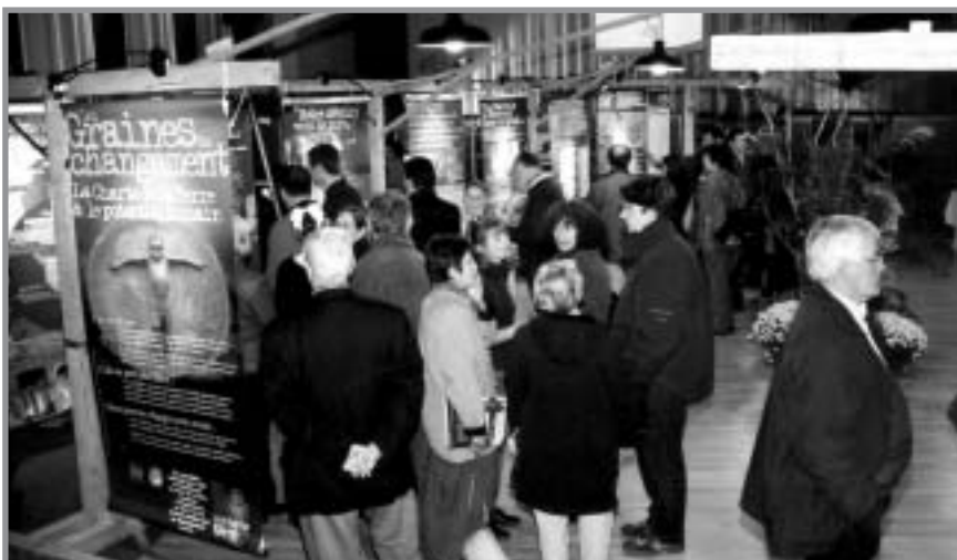
Les panneaux de l'exposition offrent une vue générale des problèmes auxquels la planète est confrontée et présente des exemples d'individus dont les initiatives à un niveau local ont conduit à des changements profonds