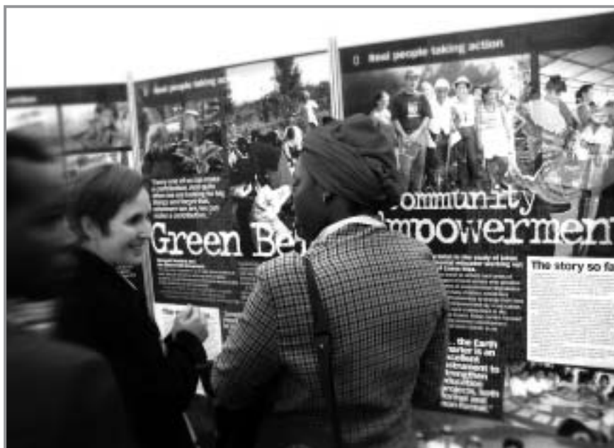
L'exposition à Johannesburg en 2002

Un professeur retraité semblait si découragé et si triste en entrant dans la tente que le personnel de l'exposition en a été très touché. Il est longtemps resté debout devant les photos de "Dialogue avec la nature" et s'est dirigé en parlant vers le personnel en souriant. Il leur a dit qu'il se sentait revivre, qu'il voulait accomplir quelque chose, et ce à comp-