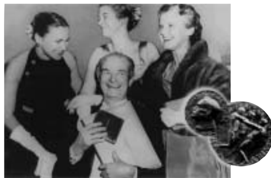
Prix Nobel de chimie et prix Nobel de la paix

UN GÉANT DE LA SCIENCE, UN PARTISAN D'UNE VIE EN BONNE SANTÉ ET UN CHAMPION DE LA PAIX