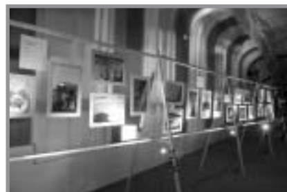
En ouverture de l'exposition, des photographies de Daisaku Ikeda de la série Dialogue avec la nature

bien réalisés. Plus de deux mille visiteurs étaient attendus du 7 au 18 novembre à l'exposition, présentée par la SGI et l'Initiative de la Charte de la Terre.