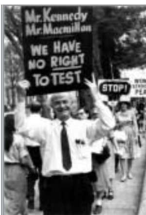
Militant pacifiste depuis 1946

Au printemps 1997, le projet d'exposition fut officiellement initié par les engagements combinés de trois sponsors: la famille Linus Pauling, l'université d'État de l'Oregon et la Soka Gakkai internationale. Les sponsors s'entendirent sur la nécessité de créer le Comité de l'exposition Linus Pauling. Furent invités à siéger à ce conseil: des lauréats