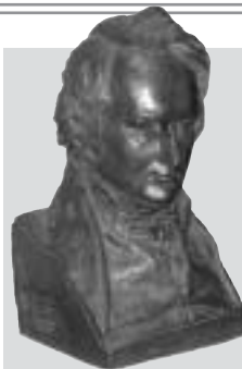
Victor Hugo par David D'Angers (1837)