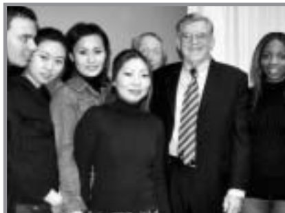
Linus Pauling Jr rencontre des étudiants adhérents de la SGF au centre culturel de Paris

Plus tard, bien qu'ayant quitté le domicile familial, je restais au courant des activités de mes parents. Soldat, j'ai entendu parler de l'incarcération de citoyens américains d'origine japonaise car le gouvernement doutait de leur loyauté. Relâchés à la fin de la guerre, certains sont venus s'installer en Californie. Mon père en a embauchés en tant que jardiniers, et cette action a attisé la colère. Lors de mes permissions, je découvrais des menaces de mort, des traces de vandalisme. C'était au début de 1945, juste avant que mon père ne débute une campagne d'éducation publique sur les dangers des armements nucléaires, une période difficile pendant laquelle mes parents étaient protégés par la police.