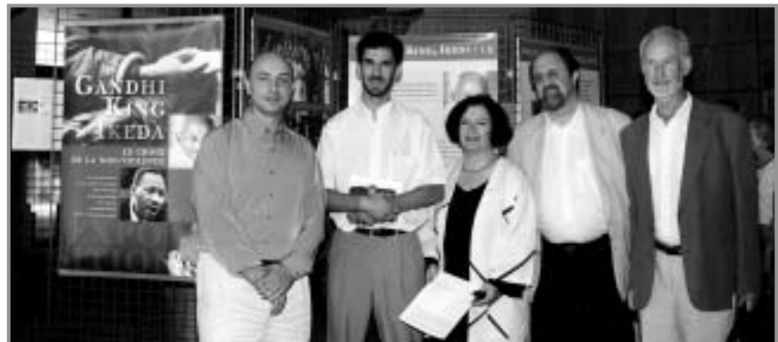
Les intervenants du forum devant les panneaux de l'exposition "Gandhi, King, Ikeda" de la Chapelle internationale Martin Luther King qui fut inaugurée le même jour.

La société ne peut être en paix si le monde n'est pas en paix. Il y a une dimension universelle. Le Prophète dialogue avec chaque homme, gardant l'idée qu'il ne détient pas la vérité. Il ne peut y avoir de dialogue si on est sûr de détenir la vérité. Trop souvent chacun a le sentiment de détenir la vérité et on ne peut plus discuter avec soi-même, avec sa femme, sa famille et c'est ce qui se retrouve au niveau des États qui s'affrontent. Ces rencontres, comme aujourd'hui, permettent de se protéger de la violence, de mieux se comprendre, de se respecter. Un monde sans violence est utopique, mais on peut construire un monde avec beaucoup, beaucoup, beaucoup moins de violence.